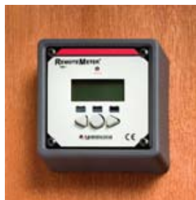
Montage dans le cadre