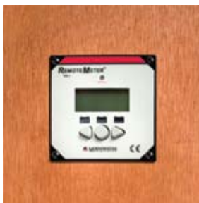
Montage dans le mur