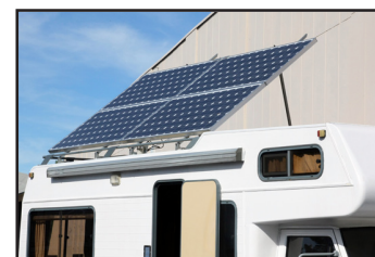
Véhicules de loisirs, caravanes