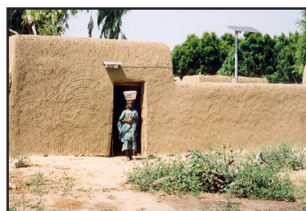
Électrification des zones rurales