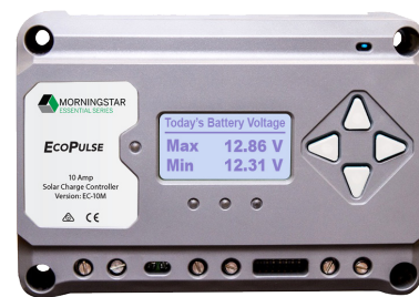
Version avec compteur

L'EcoPulse est un régulateur de charge solaire à modulation de largeur d'impulsions (MLI) de la gamme de produits Essential Series™ de Morningstar qui assure des fonctions essentielles de régulation d'énergie autonome. Facile d'emploi, ce régulateur est conçu pour des applications résidentielles et récréatives grand public.* Ce produit existe en version avec ou sans compteur à des intensités de 10, 20 et 30 ampères pour des systèmes d'alimentation par batterie de 12 et 24 volts.