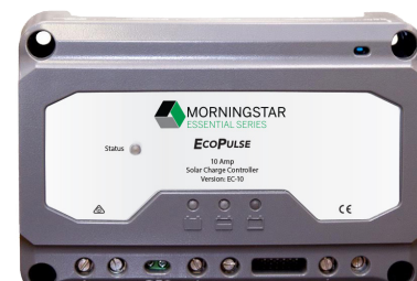
Version sans compteur