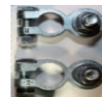
Accessoire en option