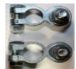
Accessoire en option